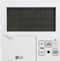
RS2 bediening PREMTB001 PREMTBB01