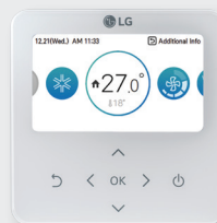
RS3 bediening PREMTB100 PREMTBB10

De LG cassette units zijn inbouw-airconditioning systemen. Ze zijn speciaal ontworpen voor situaties waar een airconditioner onopvallend aanwezig moet zijn. De cassette units zijn geschikt voor vrijwel alle professionele toepassingen: winkels, kantoren, praktijkruimten, apotheken en restaurants. De unit wordt grotendeels in het verlaagd plafond geïntegreerd. Het gedeelte dat zichtbaar blijft (de grill) heeft een stijlvol design en valt hierdoor nauwelijks op. Het is ook mogelijk om optioneel een aanwezigheidssensor toe te voegen voor meer comfort en energiebesparing. Met de wifi module is het mogelijk de units te bedienen op afstand met de LG ThinQ app.