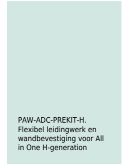
PAW-ADC-PREKIT-H. Flexibel leidingwerk en wandbevestiging voor All in One H-generation