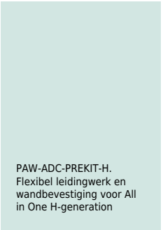
PAW-ADC-PREKIT-H. Flexibel leidingwerk en wandbevestiging voor All in One H-generation